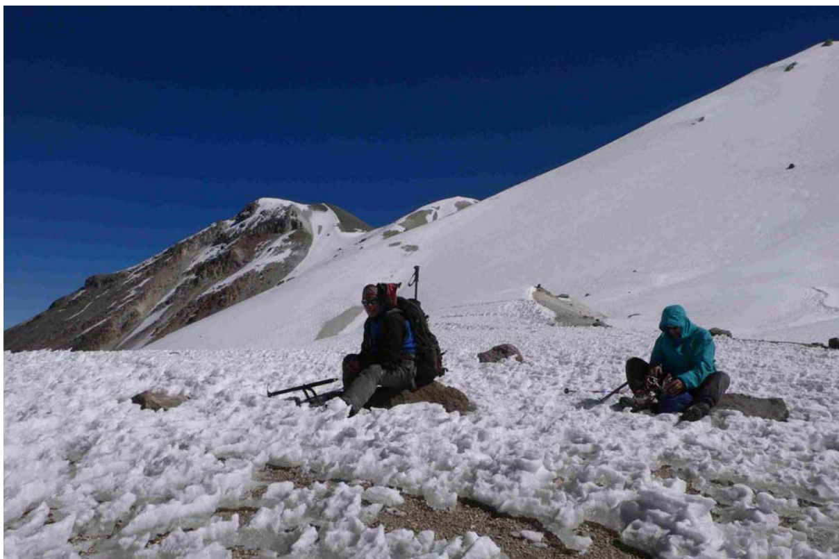
CHACHANI - sedlo 5600 m