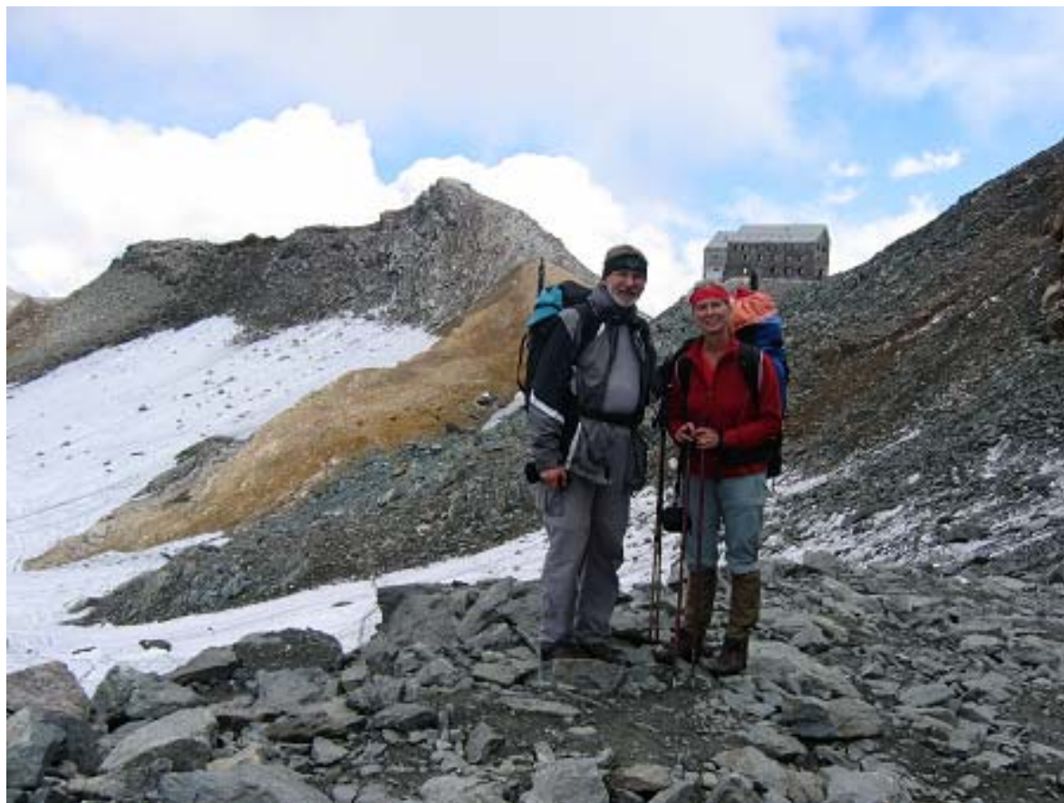
před námi Allalinhorn