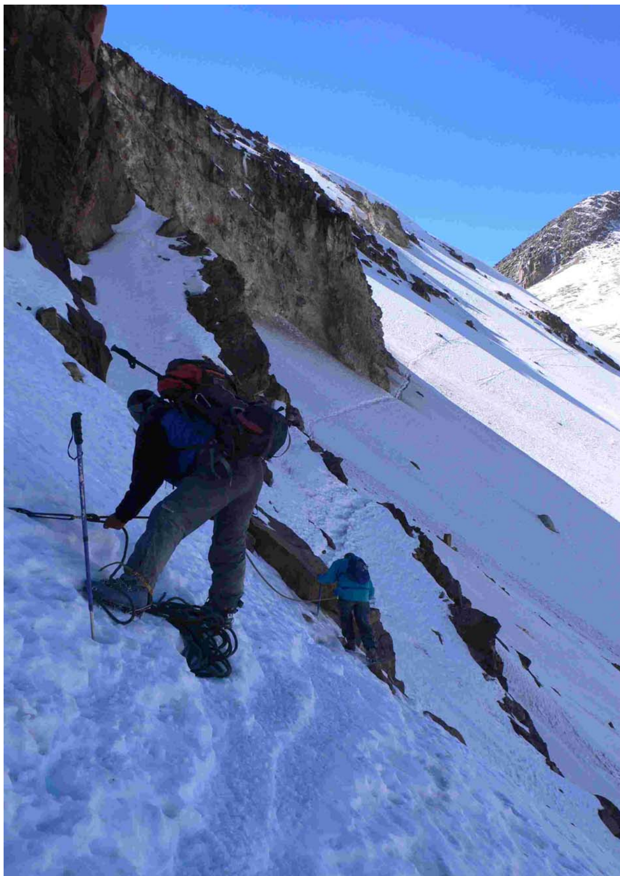
CHACHANI – traverz při návratu