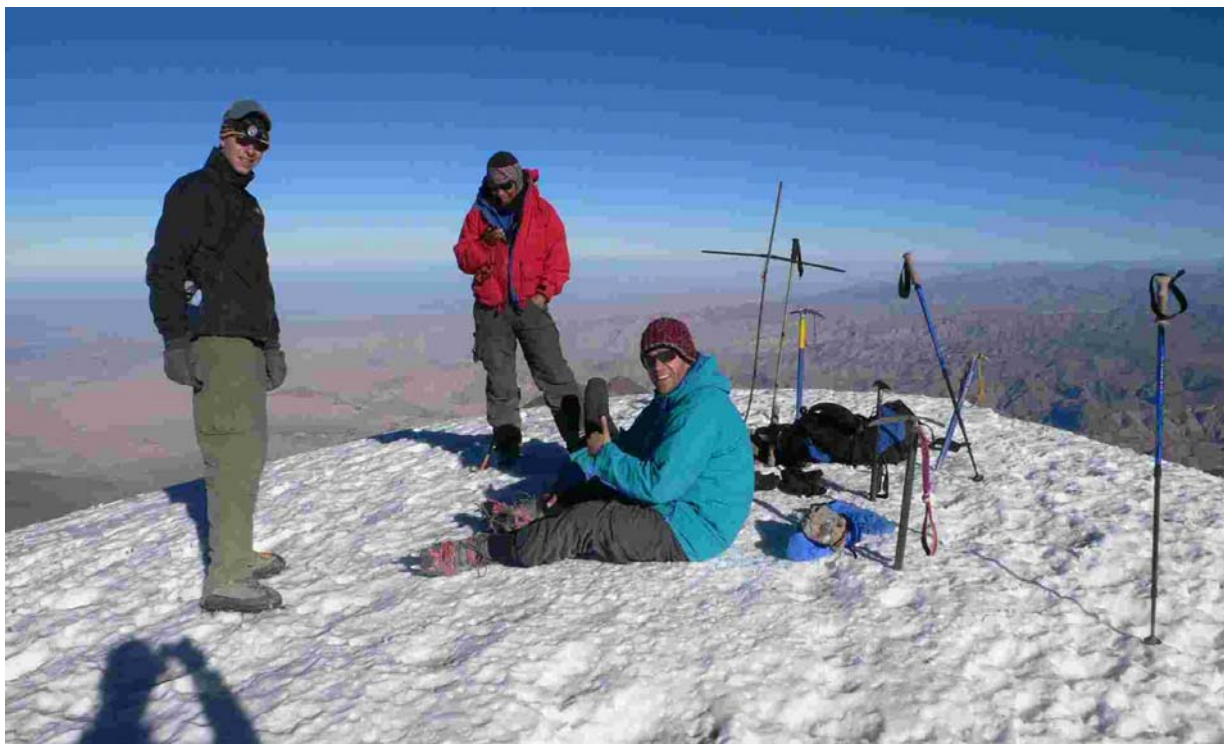
CHACHANI – vrchol

Chvíli po osmé začínáme scházet a cesta nám už ubíhá podstatně rychleji až na těch nezbytných 300 m výstupu v šikmém traverzu na sedlo, který mi dává co proto, i když je ve výšce jen 5300-5600 m.