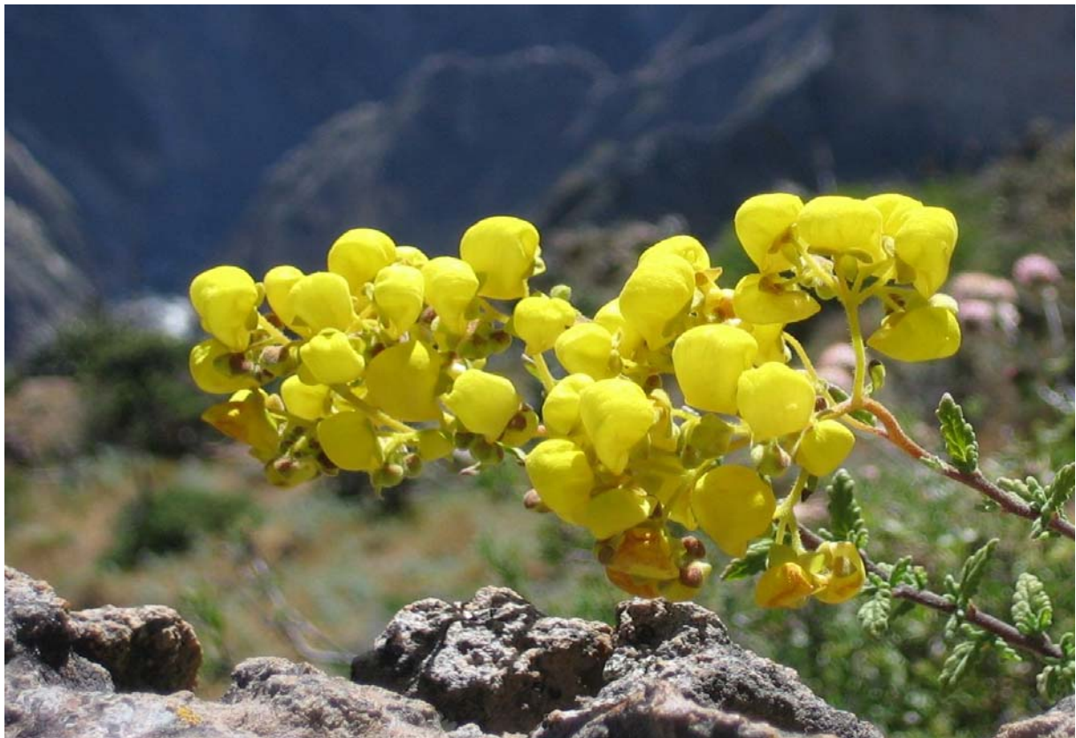
Kaňon COLCA – oživení horské pouště

A k tomu přidejte jednoznačně nejznámější obrázek z Peru, ale i z celé Jižní Ameriky – impozantní a až nepochopitelné incké město MACHU PICCHU a je zcela jasné, že na Vašich toulkách po matičce Zemi nemůžete tuto zemi opominout.